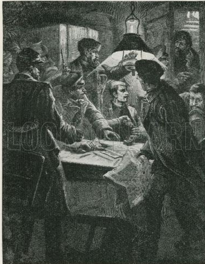
POLICE SURPRISING A MEETING OF RUSSIAN NIHILISTS