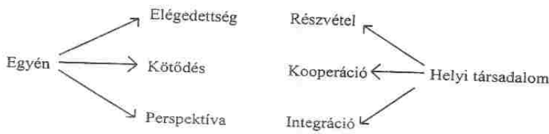
7. ábra: Az egyén és a helyi társadalom kapcsolata

E kapcsolatrendszer sémáján jól látható, hogy az individuuum személyes indítatású, elemi viszonya, a lakóhellyel való elégedettség, a helyhez való kötődés, ragaszkodás hogyan – milyen, minőségileg egyre fejlettebb viszonyokon keresztül – vezet a legmagasabb rendű fokozatig: az adott társadalom életében való tevékeny részvételig. A részvétel e tekintetben már nemcsak a szubjektív igény kifejeződése, hanem az adott település belső struktúrája hatalmi viszonyai által meghatározott „társadalmi mozgáster” tartalmi fokozata. Az egyén csak az utóbbi által válik „lakópolgárrá”. PÁL LÁSZLÓ szavaival: „... a lakónépességnek csak azok az egyénei minősülnek lakópolgároknak, akik valamilyen lényeges vonatkozásban közvetve vagy közvetlenül részt vesznek a település sorsát meghatározó döntési folyamatban. Ebből az is következik, hogy akiknek semmiféle formában nincs az utóbbira módjuk, azok a helyi közéleten, politikán kívül rekedt, feltehetőleg társadalmilag is marginális szférába kerülnek valamilyen oknál fogva, s mint súlytalan, jelentéktelen szereppel bíró egyének a társadalom perifériáján léteznek.”